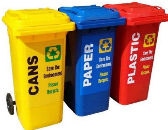
ตัวอย่างถังขยะแยกประเภท