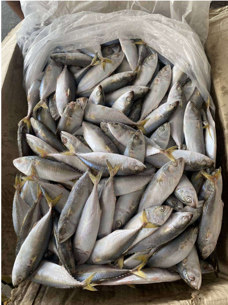
ปลาทุแท้/ปลาทุสั้น