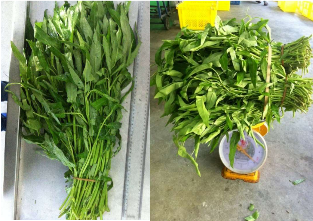
ผักบุ้งจีน