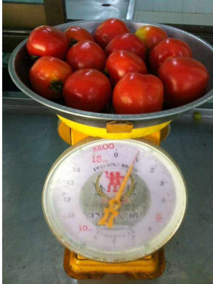
มะเขือเทศ (ท้อ)