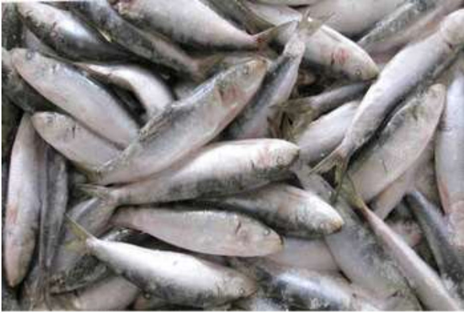
ปลาซาติน