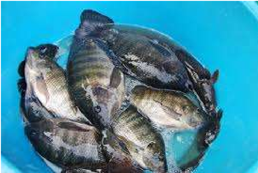
ปลาเกล็ดน้ำจืด