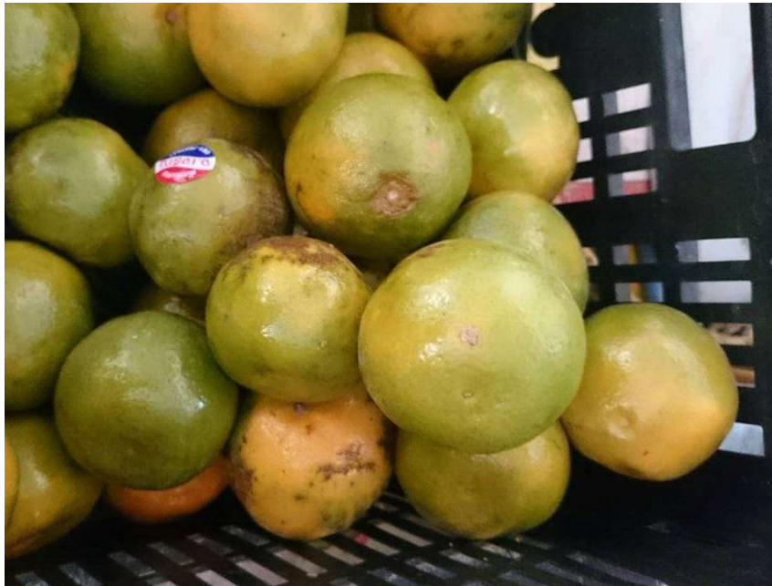
ส้มเขียวหวาน