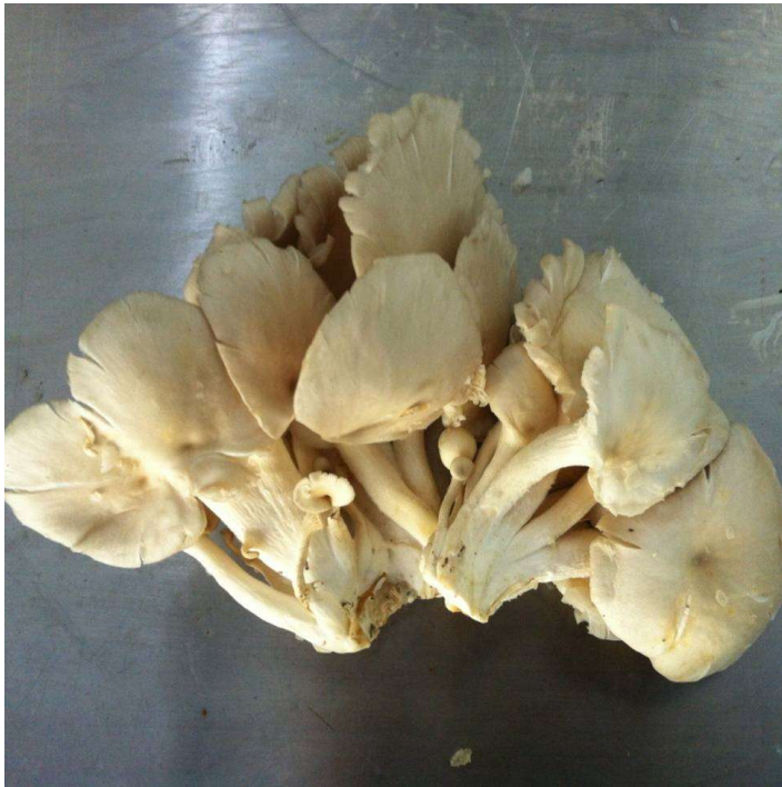
เห็ดนางฟ้า