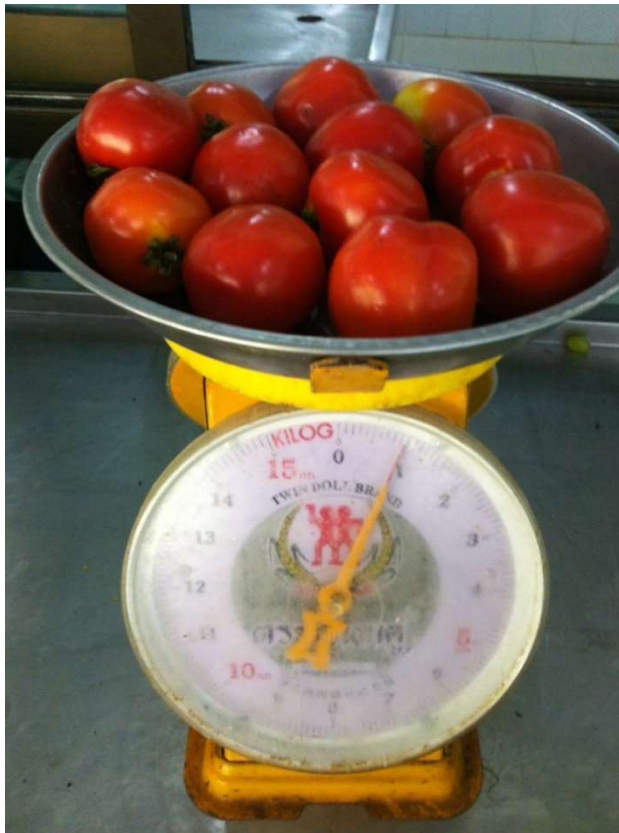
มะเขือเทศ (ท้อ)