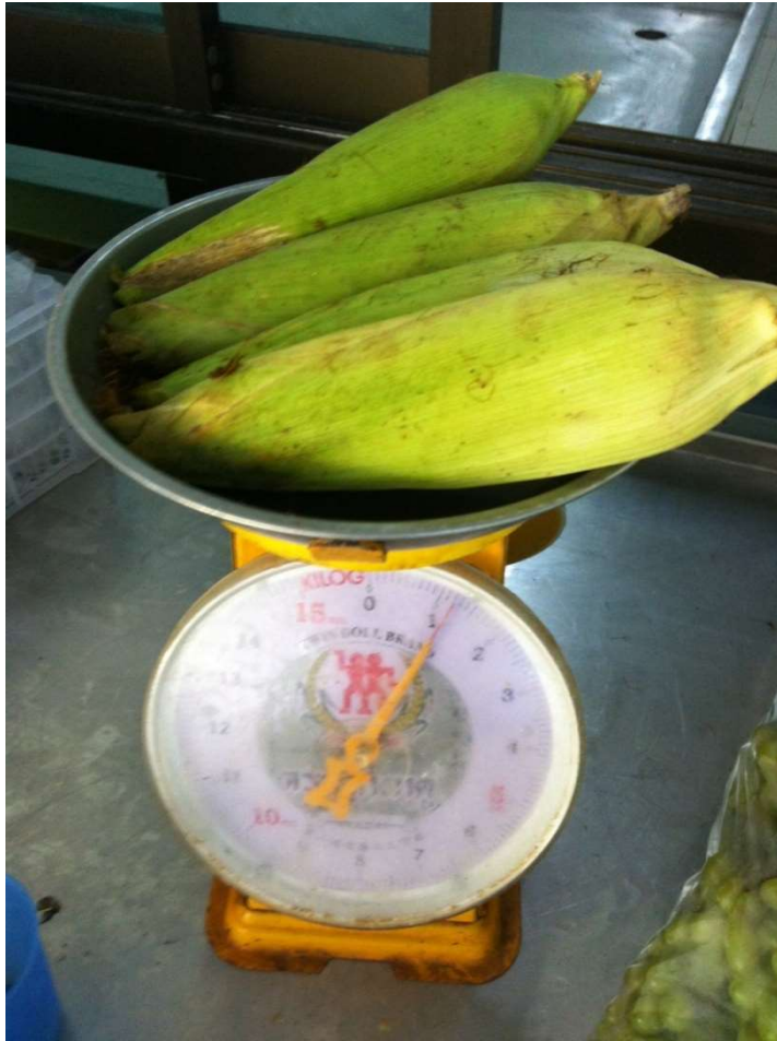
ข้าวโพดหวาน (มีเปลือก)