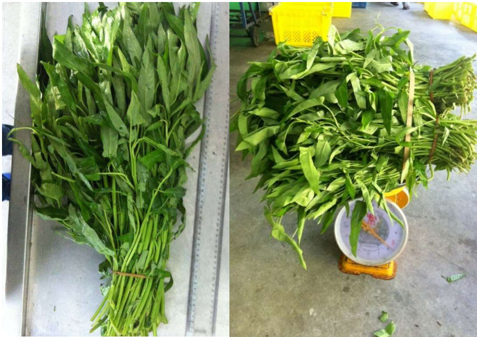
ผักบุ้งจีน