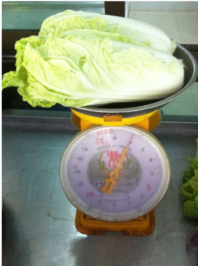
ผักกาดขาว