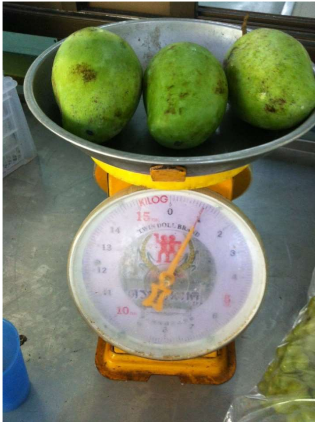
มะม่วงดิบ