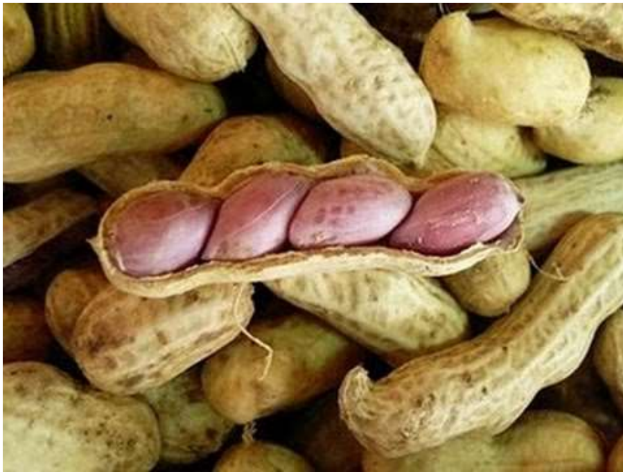
ถั่วลิสงอบ (ทั้งเปลือก)